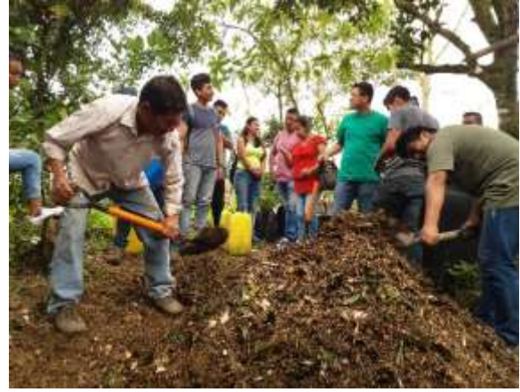
Capacitación en elaboración de abonos orgánicos (Compost tipo bocashi)