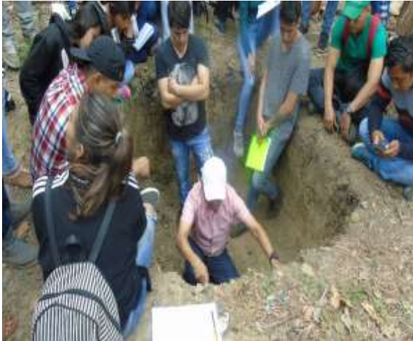
Capacitación en construcción de calicatas y análisis de perfiles de suelo