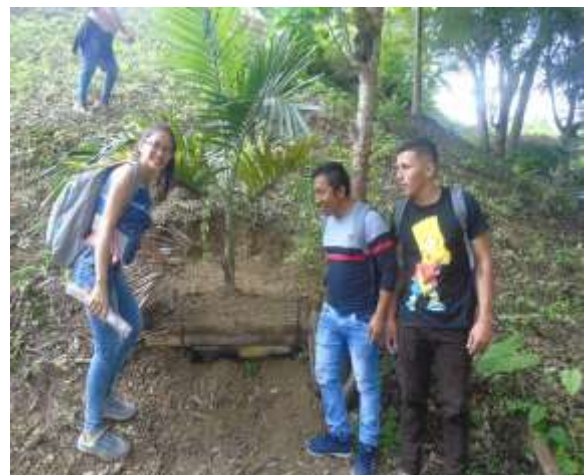
Construcción de terrazas individuales