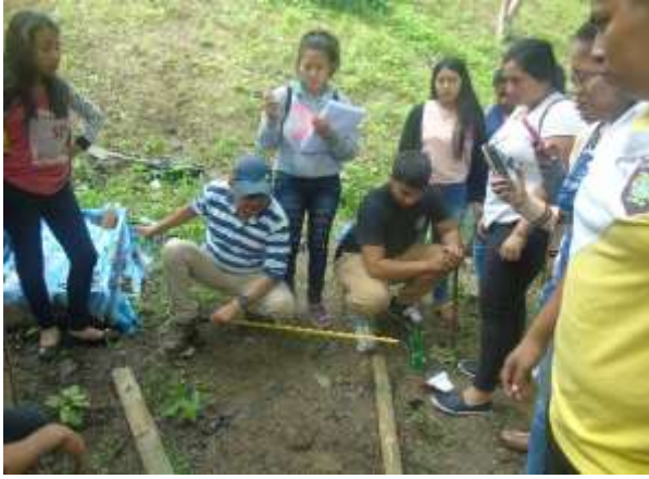
Capacitación en prácticas de conservación de suelo (trazado con nivel en A)