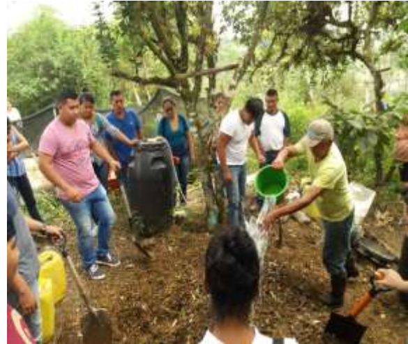
Capacitación en elaboración de abonos orgánicos (Compost y biol)